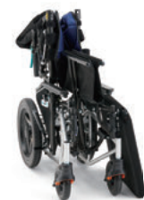
※ミキの車いすはコンパクトに折りたためます。