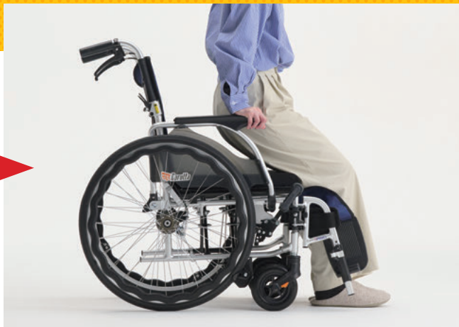
立つ(お尻を浮かす)とノンバックブレーキシステムが作動