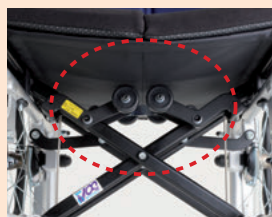
ローラー部(着座状態)