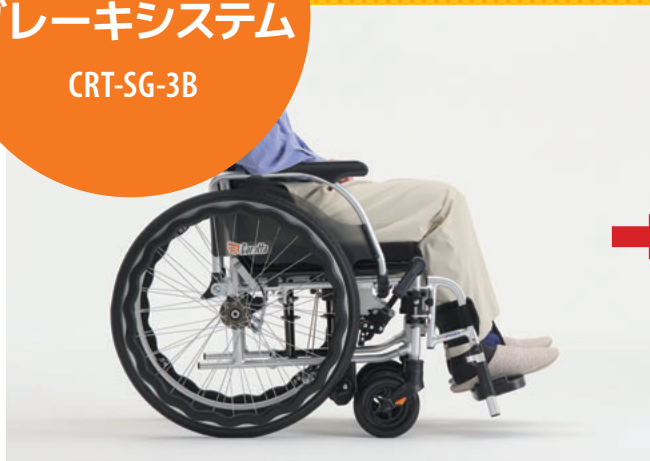
座るとノンバックブレーキシステムが解除

使用者がお尻を浮かすとノンバックブレーキシステムが作動、 駐車ブレーキのかけ忘れによる転倒事故を防ぎます。