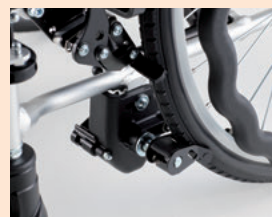
ブレーキユニット